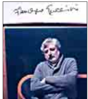
Guccini firma la prefazione

NON sorprendetevi se sullo scaffale vi capiterà di imbattervi in un libro assolutamente originale e mai visto. Un progetto musicale inedito in Italia: "Psicantria", il manuale di psicopatologia cantata di Gaspere Palmieri e Cristian Grassilli , che esce con la prefazione di Francesco Guccini . In libreria e nei negozi di dischi per i tipi delle edizioni La Meridiana, collana Premesse per il cambiamento, il manuale è un libro-cd realizzato da Palmieri (psichiatra e cantautore) e Grassilli (psicoterapeuta, musicoterapeuta e cantautore) che sarà presentato nella nostra città, domani alle 18 per la festa natalizia nell'Aula magna della facoltà di Medicina e Chirurgia, all'Università di Modena e Reggio Emilia. L'idea di un "manuale di psicopatologia cantata" è nata da due giovani cantautori emergenti emiliani, convinti che il mondo musicale aiuti a entrare nella complessità del sistema psichiatria/sofferenza mentale. Scritto con la collaborazione dell'UniMoRe.